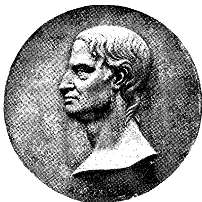
Toisen pitkän sivun reliefit: Porthanin koulusta lähteneiden Tengströmin ja Franzénin muotokuvat

nut jo aikaisemmin saatuaan opettajanpaikan Suomen taidedehdistyksen piirustuskoulussa.