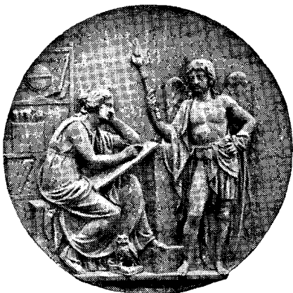
Toisen pitkän sivun reliefit: Tiede esitettyä istuvana naishenkilönä. Taustalla Porthanin urna, johon sureva Suomi nojaa ja jota rauhan hengetär palmunlehvillään varjostaa. Toisessa kuvassa historia, jolle Suomi sanelee, kirjoittamassa muistiin poismenneen ansiot

Pian kysymys tuli myös julkisen keskustelun kohteeksi, kun Cygnaeus ehdotti Suomalaisen Kirjallisuuden Seuran kokouksessa, että patsas pystytettäisiin Helsinkiin. 13 Hänen keskeiset näkökohtansa tämän kannan puolesta olivat — edellä mainitun konsistorin mielipiteen lisäksi — väitteet, että turkulaiset eivät olleet keränneet riittävästi varoja ja että Porthan oli ollut yliopistomies, joten hänen muistopatsaansa kuului yliopistokaupunkiin. Lisäksi Cygnaeus lausui, että jos Porthanin patsaan oli innostettava nuorisoa isänmaallisuuteen, niin se tekisi sen parhaiten Helsingissä. Mutta vaikka ehdotus saavuttikin huomattavaa kannatusta, siirtyi päätöksenteko seuraavaan kokoukseen.